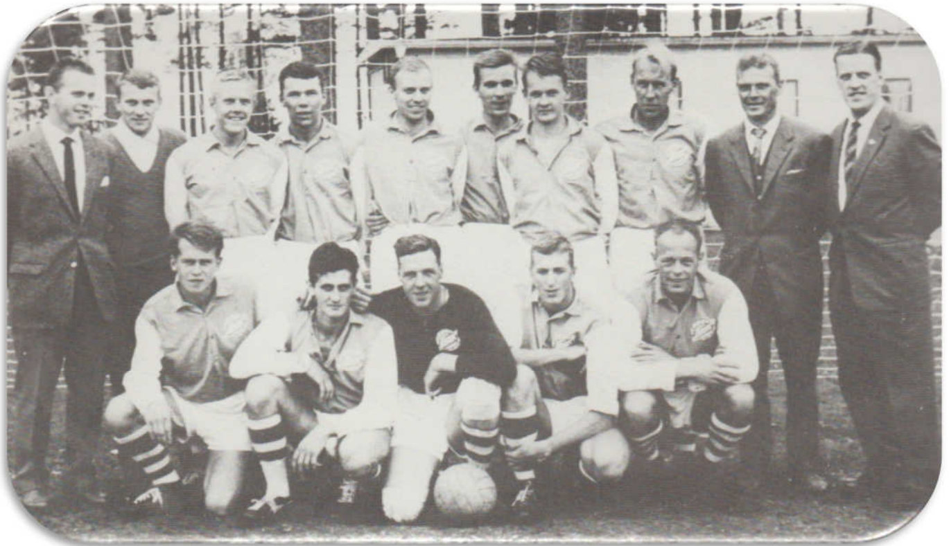
Laget som vann serien 1961.